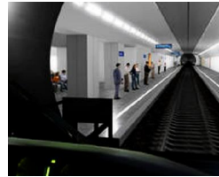
Die Hoffnung stirbt zuletzt: Seehofer hat Entscheidung über... von Ralf Wiedenmann