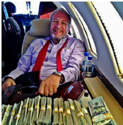
Exklusive -2.500€ am TAG!