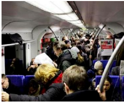
Münchens S-Bahnausbau darf nicht bei 2. Stammstrecke... von Ralf Wiedenmann