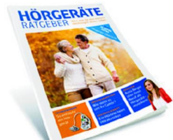
Hörgeräte-Ratgeber kostenlos anfordern