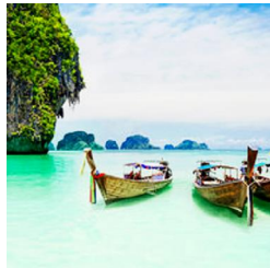
Jetzt Herzenswünsche erfüllen!