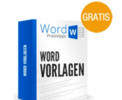
Gratis: Kündigungsvorlagen zum Download