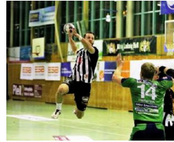
Deutscher Erfolg der TuS-Panther mit Anlaufschwierigkeiten von Erich Raff