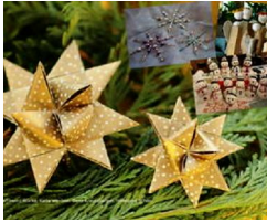
Gewinnspiel "Weihnachtsgeschenke selbst gemacht": myheimat... von Daniela Brüning