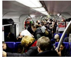
S4-Ausbau muss unbedingt gleichzeitig mit 2. Stammstrecke... von Ralf Wiedenmann