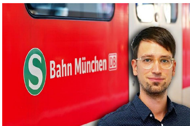
Der AZ-Lokalchef Felix Müller über eine mögliche Ring-S-Bahn in München.

Die Ring-S-Bahn in München ist keine Universallösung, aber durchaus eine sinnvolle Ergänzung. Der AZ-Lokalchef Felix Müller über das Großbauprojekt.