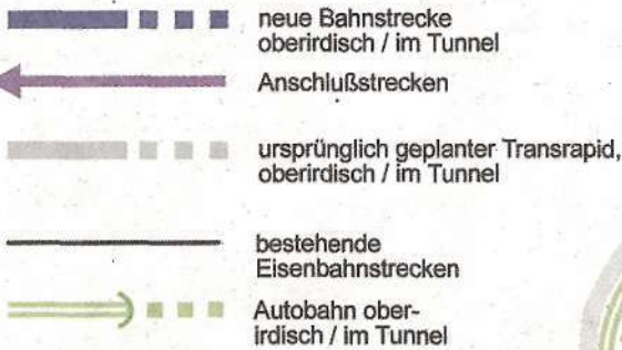
Chart 3: Nordtunnel Variante A1a im Regional- und Fernverkehr (ohne S-Bahn)