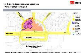
Beim Bau des Tunnels für die zweite S-Bahn Stammstrecke soll es nur am Orleansplatz eine offene Baustelle geben. Illustration: DB

Haidhausen · Auf der außerordentlichen Bürgerversammlung in der vergangenen Woche im Hofbräukeller haben die Haidhausener ihr Nein zur zweiten S-Bahn Stammstrecke noch einmal deutlich bekräftigt.