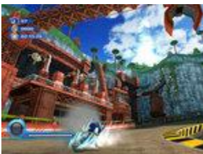
Screenshots aus Sonic Colours