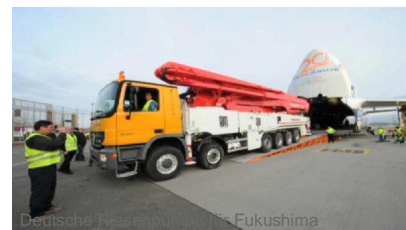
Fukushima: Neue Innen-Aufnahmen aus AKW Eisbär Knut: Todesursache geklärt