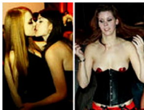
So heiß feiert München Halloween