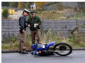
Bilder vom Motorradunfall in Freising